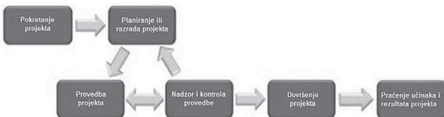
Slika 1. Faze provedbe projekta